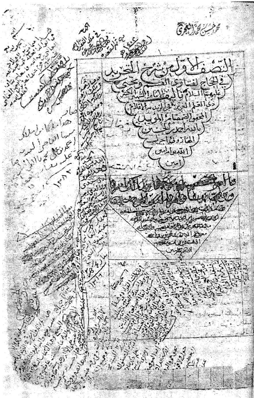
الصفحة الأولى من المخطوطة (ب) الجزء الأول.